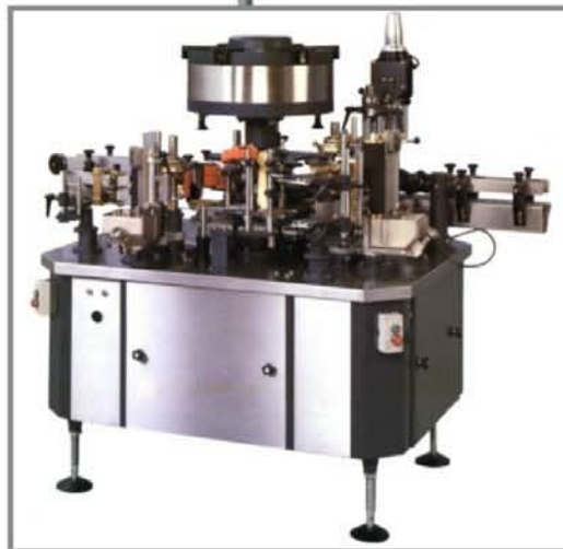
CG80 オペレーション側