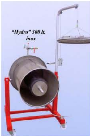
カス出し作業の簡単なスイングタイプ

ウォータープレス/HYDROシリーズはローコストアルミペイント仕様と錆のないオールステンレス仕様。 20Lt~300Ltまで多彩なラインナップ。