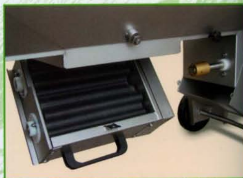
Gruppo pigiante Mod. "RF"

VRF vasca di raccolta con motoriduttore collection tank with gearmotor Sammelwanne mit Getriebemotor recipiente de recogida con motor reductor. bac de récolte avec moto-réducteur